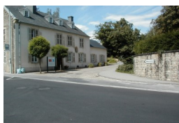
Entrée au campus de l'Université de Luxembourg, 162a, avenue de la Faïencerie, Luxembourg - Limpertsberg

Cours du soir: du 17 au 28 juillet 2017 de 18h30—20h30